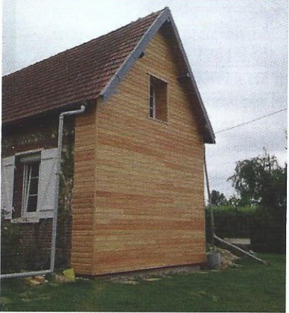
Maison en Haute-Saône avant...et après ITE